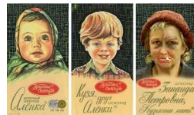
Ещё одна Кузькина мать

Надо отметить, что бомба была испытана в половинную мощность — вместо второй урановой оболочки, дававшей основную накачку мощности, была вставлена свинцовая. Полная версия этого квадратно-гнездового экстерминатуса должна была иметь мощность около 100 Мт — вот бы лулзов-то было! Когда забугорные лидеры спросили у Хрущёва , почему же он испытал бомбу не во всю дурь, он ответил: «Мы не желаем выбивать окна в своём доме» (хотя зомбоящик утверждает, что в домах в 1000 км от места испытаний окна таки вылетели). Реальная причина проста — в случае взрыва на полную мощность выброс радиоактивного говна составил бы 50 МКюри (как Чернобыль ), правда, до американского Ivy Mike с его ~80 МКюри далеко. А так, где-то 1,5 МКюри [3] , очень чисто. Ещё одна причина — боялись, что прохерчат дырку в земной коре.