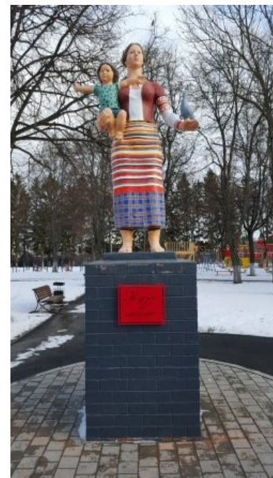
Памятник Кузе и его маме

Помимо быстрого и дешевого варианта торпеды, был разработан проект 150-мегатонной боеголовки для гигантской баллистической ракеты UR-500. Когда Хрущев увидел проект ракетного комплекса, он сказал главному конструктору Челомею: «Что мы будем строить? Коммунизм или шахты для твоих ракет?» Проект быстро завернули, но ракета осталась, и сейчас известна всему миру под названием «Протон».