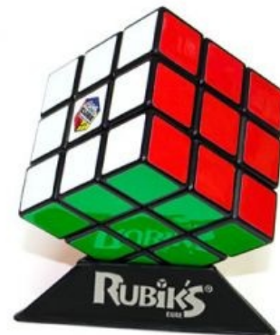
Кубический кубик Рубика