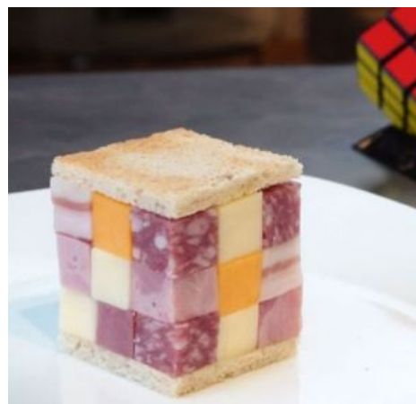
Нямка Рубика или Кубик нямика.