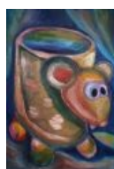
Фанарт на Кружку-куна