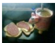
Кружка-кун снова жрёт