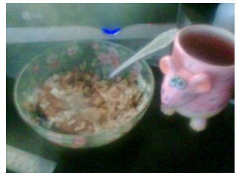
Кружка-кун жрёт своё хрючело .

«День добрый, %название чана% ! Это я. Вот у меня тут %говно_1% , %говно_2% с %говном_3% , а так же %моча% . А чем %травился% ты, Анон?».