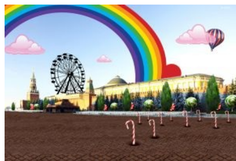
Веселье только начинается