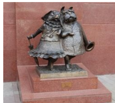
Памятник собачкиной столице