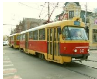
Прошлое краснодарских трамваев

Ввиду того, что город не предназначен для понаехавших, «достопримечательности» весьма специфичны, зато доставляют.