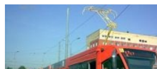
Где то между настоящим и будущим