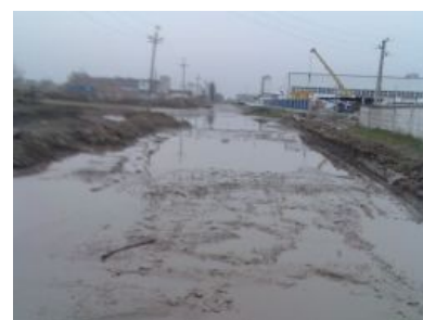
Зима в Краснодаре

Небольшой климатический рай наступает лишь во второй половине сентября — начале октября и длится