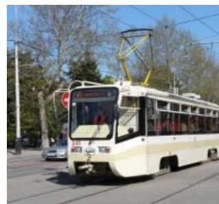
Настоящее как оно есть