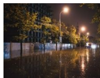
Типичная улица после дождя