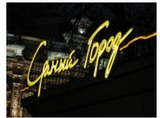
Так ещё называют город

• Толчок — он же «Вишняки» — вьетнамско-армянско-вещевой рынок , торгующий шмотьём а-ля «дольче и гондвана», а также лицензионными айфонами. По сути своей целиком и полностью — местный Черкизовский рынок . Народный фольклор с ним связан точно такой же.