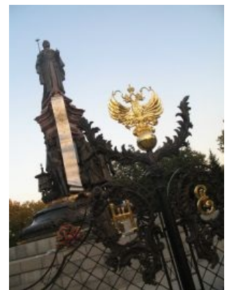
Породительница всех этих Екатерино-Красно-Путино(?)даров и причина нынешнего срача

Видя неминуемый провал затеи, власти начали псевдоактивную агитационную кампанию с билбордами, адресными аншлагами, указывающими название улиц в Екатеринодаре, и ток-шоу по местным каналам, где народу наглядно объясняют, почему такие изменения крайне необходимы, при этом давая на поцреотизм и просто рассчитывая на ебенячую тупость населения, которое будто бы радо переименовать город в честь казаков, но мы-то знаем, что это .