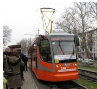
Где то между настоящим и будущим