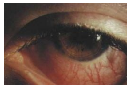
Этот глаз смотрит на тебя как на виндюзятника

Красноглазики — ироническое обращение к компьютерным гикам, в основном, к линукоидам . Часто используется в виде производных от этого слова. Следует отличать красноглазиков программирующих/ админящих от упоротых норкоманов , однако нередко классификация осложняется отсутствием различий.