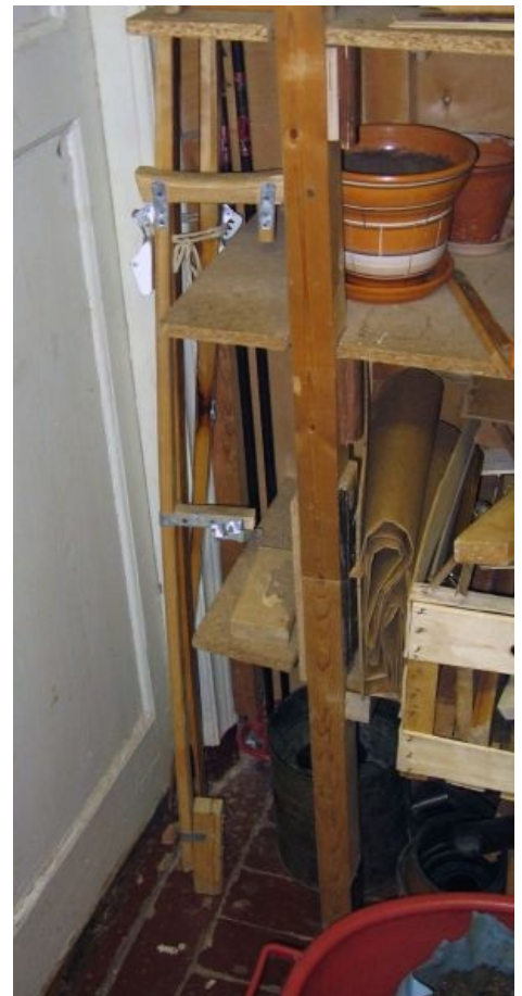
Рекурсивный костыль IRL , исправляющий сам себя.

При написании программ для Microsoft Windows некоторые программисты полагались на баги WinAPI. Позднее, при создании свободной реализации WinAPI Wine , эмуляцию соответствующих багов пришлось добавить специально, чтобы обеспечить совместимость этих программ с Wine. Некоторый лулз состоит в том, что в MS при разработке новых версий софта занимаются тем же самым ради совместимости с предыдущими версиями.