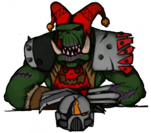
Анус себе потуши, сквиг!

Падъезжаем мы к чилавечьюму лагерю, и тут Галка как крикнет в рацию "Атакованы превосходящими силами противника! Вынуждены отступить!" Ну чиста па чилавечье, как космобанка, пока ей шлём не атарвёшь! Ну чилавеки забегали, засуетились, сразу варота в лагерь аткрыли. Мы втехали, сразу из вагона навыскакивали. Чилавеки аж от удивлению абассались! Штобы орки, да на ихнем вагоне, да в ихний лагерь? Сразу в Кодекси Усрартес рыться начали. Ани ваабце, эти синемарины, чуть что - сразу в кодекс... Мазгов совсем нет, думать нечем! Можит, патаму оне в бой без шлёмов идут! Ха-ха-ха! Ну начала мы тут чилавецев стрелять и резать. Дробовец из сваиво драбадана в воздуха шарахнул. Я иму - "Пачиму, ни па чилавекам?" А он мне - "А если я па чилавекам выстрелю, как наши паймут, што атаковать пара?" Ха-ха-ха, каббудта если выстрил ни в неба, иго никто ниуслышит! Хы-гы-гы! А тут Оруцый Зад подошёл. Вышел, он, значит, с парнями из кустов и как заорёт сваей гаваряще жопой "Нет бога кроме Бога Истинава Йумора, а Питроз - Прарок Иво!" И тута усё и завертелосся...»