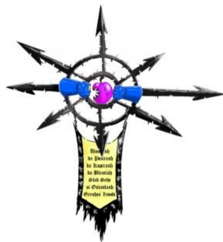
Личное знамя Азисуса