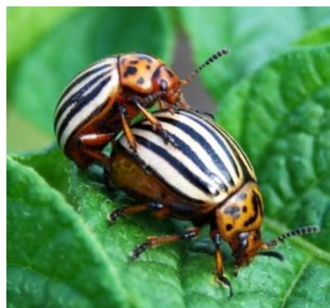
Герои статьи за любимым занятием

Колорадский жук издавна жил в Мексике и никого особо не доставал, но в 19 веке получил прозвище «полосатый» или «цветастый», что в переводе с испанского означает и звучит как слово «колорадо» и никакого отношения к штату Колорадо в США не имеет потому как никогда этого жука там в помине не было. Исторической родиной этого зверька является Сонорская зоогеографическая провинция на севере Мексики, где и проживает дружная семейка из примерно 50 родственных сабжу видов, и он сам, соответственно. Так что правильнее называть его «сонорским жуком», но сейчас уже хрен кого в этом убедишь. Затем жучок медленно перевалил своим ходом через пустыни Мексики, Аризоны и Техаса, глодая редкие в тех местах дикие кормовые растения из