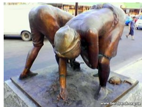
Памятник жуку в Бердянске, Хохланд. Собственно он в нижнем правом углу

А жучиха будет по ночам рыдать, Будут детки плакать, будут папку звать. Жук домой вернется, сядет у окна... Нелегко отмыться от того говна!