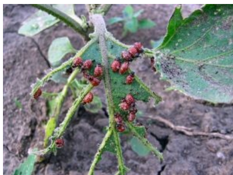
Личинки за «нямкой»

Серая жаба. С такой харей ей вс- ALL GLORY TO THE HYPNOTOAD