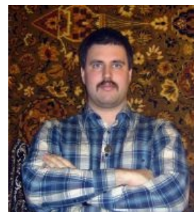
Ковёр на фоне Мицгола , 31 марта 2007 года.

Ковёр — мем, зародившийся в начале 2007 года, предположительно на фотохостингах типа flickr, а оформившийся, видимо, в ЖЖ . Проявляется в виде беснования в комментах на тему ковров. Бичует и вскрывает язвы и пороки бытового говнофотографирования, как то: убогие интерьеры, заливающая фронтальная вспышка, прыщи , спортивный костюм и, собственно, главное — маниакальное стремление к фотографированию на фоне Ковра, висящего на стене или лежащего на полу. Настоящим Ковром считается только ковёр с восточным или псевдовосточным орнаментом (обычно к Востоку не имеющий никакого отношения, штампованно пошитые на текстильных фабриках в позднем Совке). Также особо почитаем ковёр с оленями , который может висеть только на стене; класть его на пол — жуткое святотатство.