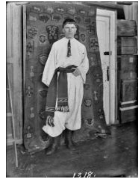
Ещё более раннее фото

Маннергейм на фоне ковра. Одна из первых известных фотографий этого жанра