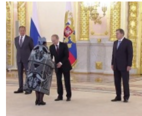
Посольский ковер на фоне Путина

Ещё более раннее фото из собрания Полтавского краеведческого музея