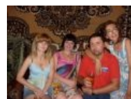
Нечто на фоне Ковра.