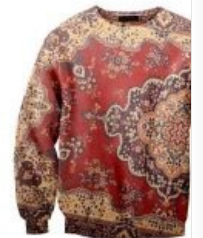
Ковёр — стильно, тепло и удобно!