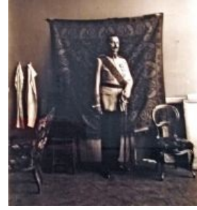
Маннергейм на фоне ковра. Одна из первых известных фотографий этого жанра