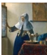
ВНЕЗАПНО - Вермер и ковёр 1657 год.