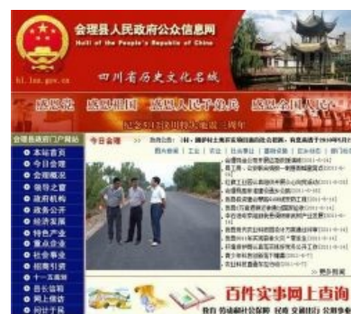
Нотариально заверенный скриншот