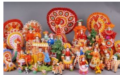
Вятская классика, она такая.

Сначала игрушка возникла как сувенир к местному локальному празднику , который остался в далёком прошлом, однако была скопипизжена совком и заново возрождена как всё тот же местный сувенир. Технология изготовления игрушки — дело достаточно сложное, если учитывать те факты, что сначала нужно стырить где-нибудь ярко-красной глины, а затем собирать эту игрушку буквально по частям,