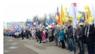
Кировчане забастовку просят