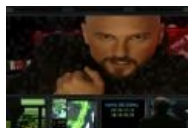
All your base are belong to us, mwah-ha-ha!