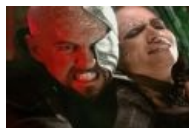
ЗАТКНИСЬ, СУКА, Я ТЕБЯ НЕНАВИЖУ!