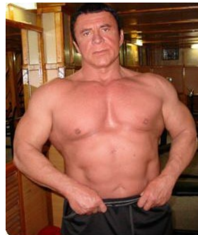
Магия есть? А если найду?

Когда ж вы по своему незнанию и неразумению уже побывали на сеансе экстрасенса или «народного целителя», не отчаивайтесь. Божья любовь сильнее за всю сатанинскую злость, только принесите глубокое покаяние ото всего сердца. Ибо другого пути спасения нет. Всегда помните слова Иоанна Златоуста: «Когда впадешь в лютую болезнь, то много кто будет тебе советовать идти к колдунам или ворожеям (экстрасенсам), ты же уповая на Бога, терпи... эти муки венец тебе приносят и спасают от мук вечных... Какая польза тело вылечить, а душу погубить...»