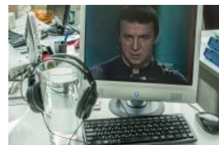
Запомни, анон, вода должна быть прокипячённая !

— У тебя крыша есть? — Нет. — Ну тогда будешь нам платить. Он даёт им 10 000 баксов: — Nate, обосритесь. Те срут день, срут второй, на третий возвращаются: — Вот тебе твои деньги, сделай так чтоб мы не срالي! — Хорошо, не срите. Те день не срут, второй не срут, раздулись уже как барабаны, на третий день решили пойти к Чумаку: — Мужик, нас тут Кашпировский заколдовал, Зй день не срём. Помогите, пожалуйста. — Щас всё сделаю, пацаны, НЕ ССЫТЕ!