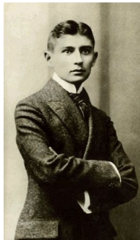
Только что увидел порождение своего подсознания.