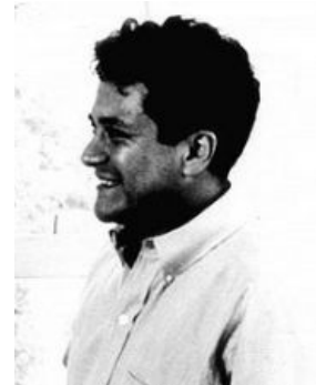
Кастанеда в зрелом возрасте