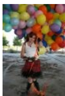
С шариками и девайсом