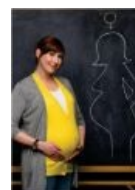
«У вас завёлся паразит» ( доктор Хаус )