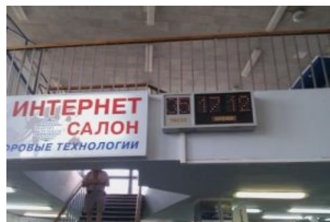
Офис ЮТК в Кисловодске, Дата съёмки 35 мая!

Наличие огромного парка и целого олимпийского комплекса, запиленного в «кислом» еще при совке, привлекает спотцменов со всей Раисси. До недавнего времени число их доходило до десятков тысяч в год. Но из-за гостей с ДС цены за съем квартир подскочили до небес и обломали множество туристов. Буквально 5 лет назад можно было на 10 килорублей кутить месяц, жрать пончики в «Снежинке» и обедать в столовке от прокуратуры, nuff said. Теперь приходится лососнуть тунца в лаваше.