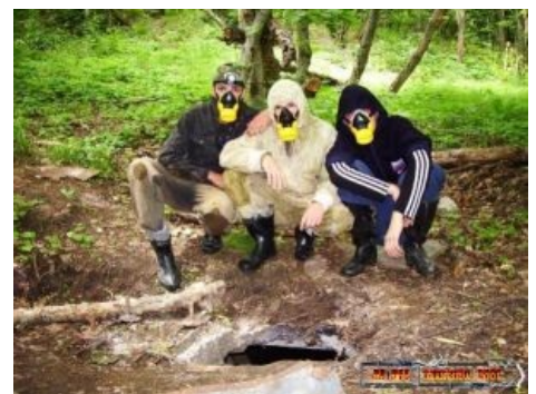
Суровые кавминводские диггеры готовятся к спуску в АД.

Пока все дохли, как мухи, довольное правительство срало-таки кирпичиками для перестройки, так как США не жертвует быдлом в личных целях, и урана, значит, у них меньше, я гарантирую это . Ещё, пока быдло пашет, правительство смело готовило научный проект, который увенчался успехом. Nuff said . Кто-то может подумать, что эти самые заинтересованные — просто идиоты, но, на самом деле, — это весьма одаренные личности, и многие из них вполне способны когда-нибудь получить небезызвестную премию . Впрочем, общавшиеся с ними вагинополообразные до сих пор шокируют все прогрессивное [ ЩИТО? ] КМВ светящимися в темноте флаерами . (спойлер: Самые продвинутые диггеры КМВ занимаются изучением покинутых мест, пусть и совсем не на законных основаниях. Их сайт: УранРуда где-то в этих ваших интернетах . Алсо, здесь проходят ролевухи с китайскими «воздушками», костюмами радиационной защиты, противогазами , хабаром и гектолитрами бухла.)