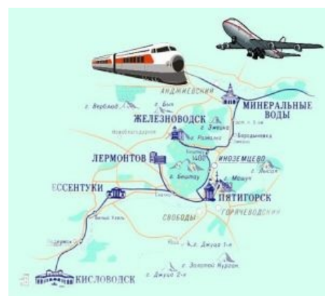
Карта с синкансеном и боингом-747.

Из КМВ произошли «Провал(ъ)»™, «Ессентуки-17», «Кисловодский нарзан», «Славяновская», «Герой нашего времени» и миксер «Машук». А также резино-техническое садовое изделие типа «калоша» (Кисловодск) и домашние тапочки на цельнолитой невьезбенно скользкой подошве (Ессентуки).