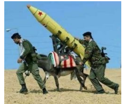
Иранский Тополь М (на ишачьей тяге).

Запуск иранских ракет — учебная акция ракетно-фотошопных войск Ирана, наглядно показавшая всему миру, что эпический фейл иногда может стать и эпическим вином.