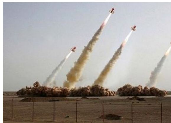
Наши штампы разгромят неверных!

официальных источников об учебном запуске не каких-то там пустынных сарацинов со своими самодельными хлопушками, а самых настоящих Официальных™ Ракет® Вооруженных Сил Ирана©, не последовало. И это при том, что учение тайным не было (игра мускулами для государства — серьёзный бизнес ). Так что вопросы «насколько эти источники неофициальны?», «кому и на каком уровне пришла в голову столь гениальная идея?» и «насколько лопухнулись западные СМИ?», остаются открытыми.