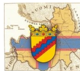
Ингрия: Ленобласть без Карельского перешейка и восточной половины