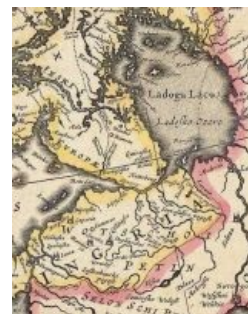
Ингрия (Ижория) на древних картах.