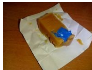
Можно и внутрь

В автосервисе: — Вы мне тут сварочкой прихватите, а я дома уже изоленгой намертво примотаю.