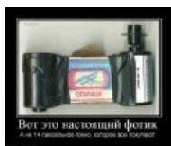
Из спичек и желудей