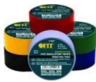
Разноцветные ниндзя катушки сабжа