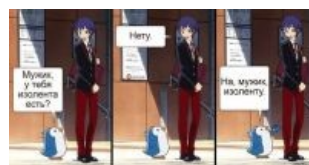
Об этом есть онемэ