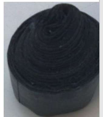
Японская из дохлого зомбоящика

«...изолента работает почти в вакууме. Изолента работает вообще везде и повсюду. Изолента — это дар богов, ей необходимо поклоняться. »