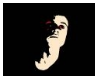
Гамаз всегда остаётся в тени