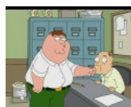
Гриффины как бэ намекээ