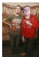
Ещё одно внезапно