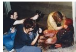
Кадр со съёмочной площадки