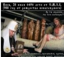
Это классика, это знать надо