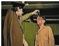
«Неси на кухню и скажи, чтобы больше такой чай мне не приносили!»