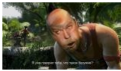
Far Cry 3