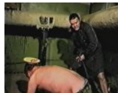
Сцена с говном