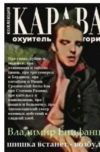
Караван охуительных историй