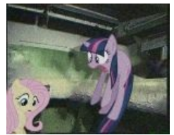
Я тебе доброе дело хотела сделать!