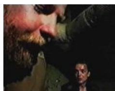
Я уже не человек , блядь, я зверь нахуй!!!