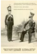
Изумрудный элѐфантъ В Rozen Maiden