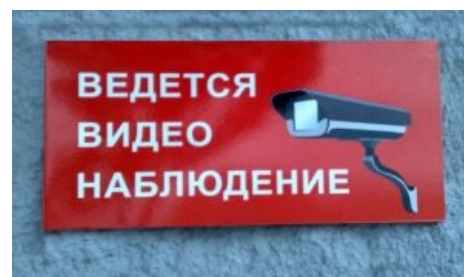
Это не всегда законно.