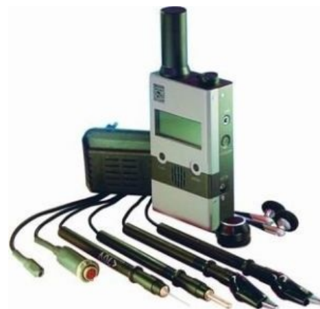
Няша. Помогает находить всевозможные КУИ и не только.