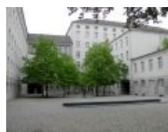
Место расстрела сегодня