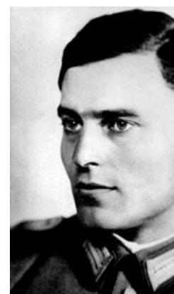
Штауффенберг даже не смотрит на тебя

Тут стоит сделать небольшое отступление о целях и задачах, которые генералы и политики германского Сопротивления преследовали в целом. По большей части данная толпа состояла из монархистов, немножко разбавленных демократами. Коммунистов же вся эта шушера ненавидела не менее, чем сам Гитлер, и видела светлую Германию в качестве передового щита просвещенной Европки от диких, варварских большевистских орд. Главной же целью данные товарищи ставили именно заключение сепаратного мира с Союзниками, но не с СССР. Последнего предполагалось экстерминировать совместными гейропейско-пиндосовскими силами. Тем самым оные граждане обеспечили топливом специальную олимпиаду на тему своей годности на годы вперед. Если западные и, особенно, россиянки либерасты в принципе не видят в таком плане чего-либо плохого, то поцреоты той и этой страны до сих пор не могут справиться с взаимоисключающими параграфами . Поскольку в голове с совковым мышлением никак не хотят вместе уместиться факты, что данные товарищи были одновременно против Гитлера (что хорошо) и против Сталина (что, естественно, плохо). Хотя любопытно, что опрос, устроенный в начале 50-х западногерманским бюро, показал: лишь треть жителей ФРГ считало героями тех, кто хотел свергнуть нацистский режим. Такие дела.