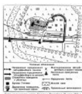
Скучная схема покушения