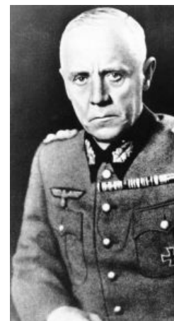
Бек смотрит как-то недовольно, свирепо и в то же время

послегитлеровского обустройства Германии и распределяла между собой же должности в новом правительстве. А вот план госпереворота был разработан только «на всякий случай» — этим случаем должен был стать пиздец в виде неизбежной войны. Однако в Вермахте все еще оставалось множество офицеров, которые хоть и не желали начинать военные действия, но и на государственную измену также вряд ли бы пошли. Хотя, к примеру, генерал Вальтер фон Браухич хоть и знал о заговоре и не одобрял его, однако стукачом решил не становиться и никого не сдал.