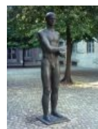
...и мемориал на нем. Возможно, символизирует