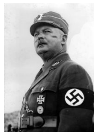
Рём замышляет недоброе

демократической победы партийные товарищи совершенно не знали, что теперь со всем этим сбродом делать. Мякоткой ситуации было то, что, во-первых, Гитлер тогда был только в начале своего превращения в великого фюрера и пока еще не имел той поддержки и полноты власти, которую заполучил позднее; а во-вторых, главным образом СА являлся вовсе не он, как можно было бы подумать, а некто Эрнст Рём — идейный ахтунг и морфинист. Причем сей товарищ страстно желал стать главнокомандующим вооруженными силами всей Германии, предлагая разогнать Рейхсвер ссаными тряпками, а в качестве армии использовать его штурмовиков. Поэтому вскоре между ним и высшим командным составом армии образовался небольшой интеллигентный диспут по данному вопросу. Кадровые вояки смотрели на штурмовиков СА как на говно, президент Гинденбург не подавал Рёму руки, а начинавшие делить власть нацисты были бы вполне не против послать все СА вместе с Рёмом куда-нибудь нахуй.