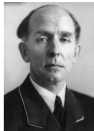
Фрейслер подозревает, что ты предатель

Казнили заговорщиков тоже оригинально: не расстрелом (как военных) и не на принятой тогда гильотине (для гражданских), а через повешение голышом на рояльных струнах, прикрепленных к крюку мясника на потолке . Причем весь процесс снимали на камеру под свет софитов, как на киностудии. Няшка Гитлер потом смотрел киношку за чаем с печеньками, а также велел показывать это солдатам и кадетам для поднятия боевого духа. Впрочем, недобитые фашисты говорят, что все это ЛППП, но мы-то знаем.