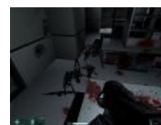
F.E.A.R. : ещё минуту назад скелеты были живыми солдатами-клонами