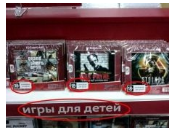
Для самых маленьких за 18 лет

Тем не менее, есть игры, которые не прошли цензуру на территории бывшего СССР. Например, в Хохляндии игра, а точнее, фанатский мод «Ghost Recon: Операция Галичина» простоял на прилавках только один день. Виною тому сюжет мода, рассказывающий об отделении расово-поцреотического Львова и западных областей от всей Украины после победы на выборах президента пророссийского кандидата . На самом деле, никакой Украины, и тем более, Львова в игре не было — просто нарезка из старых карт. Хоть игру и выпилили из магазинов, копия была сделана, и никакой Галичины и Украины в игре не оказалось.