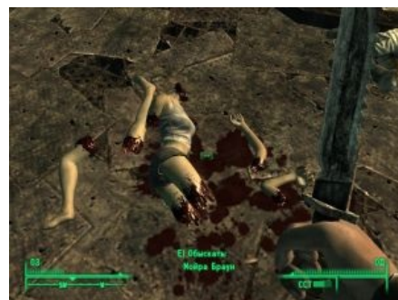
Fallout 3: персонаж, коего хотелось взять и уебать сильней иных прчих