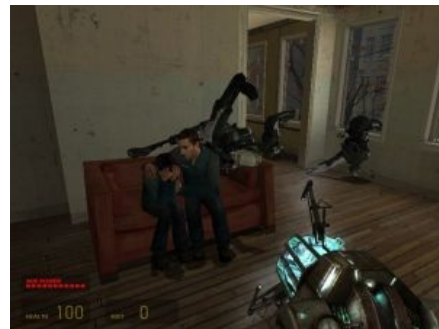
Ragdoll-издевательство в Half Life 2

Не стоит забывать про кватрологию Dead Rising , где главным героям можно и нужно было выпиливать зомбей (тоже в общем то люди... обычно случайные прохожие... были ими когда-то по крайней мере). Причем выпиливать всем, что попадется под руку. Выбор богат: от относительно «гуманных» орудий убийства (примеры: огреть по башке садовой скамейкой, раздвачевать катаной, выстрелить в голову из дробаша) до жестоких (пример: воткнуть в грызло ножницы; вставить в голову трубу с душевой насадкой, так чтобы из неё потек фонтанчик