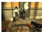
Жестоко и насильственно прибитые к стене комбайны ГО-шники в Half Life 2