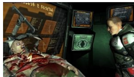
Quake 4: пехотинец смотрит на него как на говно