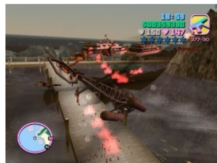
Жестокость в GTA такая жестокость