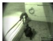
Скинутый с высоты противник в Splinter Cell Chaos Theory Поразительно, но это его не убило