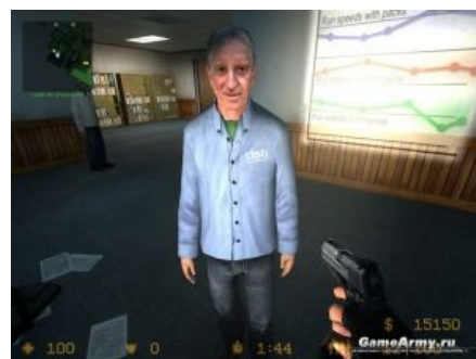
Сидит в заложниках