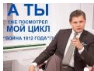
Побуждает, тыкая в тебя пальчиком