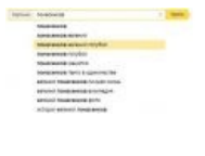
Яндекс-бомбинг что-то подозревает...