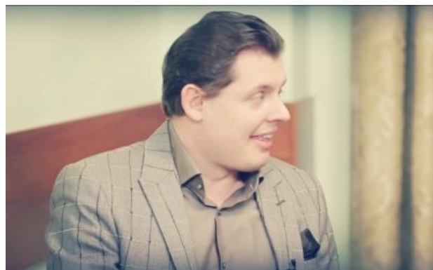
Наполеоновский профиль сабжа и скрытая в нем история болезни