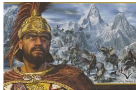
Ганнибал и его слоники в представлении игроделов

Поскольку у карфагенян кончились бабло, бухло и жратва, а римляне довили все сильнее и сильнее,