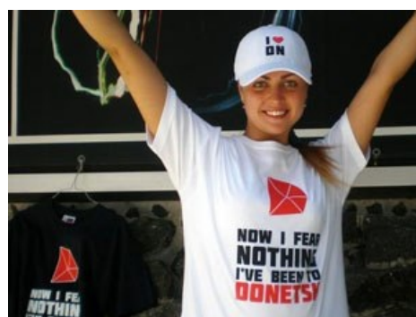
Английская болельщица на Евро-2012