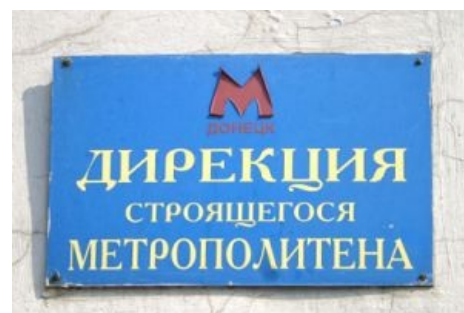
Состояние вывески как бы говорит нам об успешности работы предприятия

Оно же Домбabwe (Донбabwe) в украинских СМИ . Начиная с Евромайдана и особенно марта 2014 г. у части населения Донецка наблюдался резкий разогрев пукана. Наиболее активные взяли в руки калаши , призвали зелёных человечков [пруфлинк?] и объявили о создании Донецкой Народной Республики. Руководство Украины, именуемое донецкими сепаратистами не иначе как майданутой хунтой, фалломорфировало от такой наглости, заклеимило донетчан террористами и пророссийским быдлом и послало разбираться по очереди «Альфу», Нацгвардию и 3.5 анонимусов из 25-й отдельной Днепропетровской воздушно-десантной бригады, где те наткнулись на заградотряды интересных личностей, потеряв неизвестное число единиц бронетехники, вертолётов, самолётов, солдат и офицеров. В начале мая 2014 ДНР успешно провела референдум, а по результатам сентябрьского перемирия стала де-факто самостоятельным образованием типа Косова .