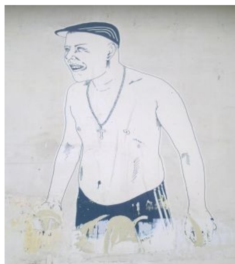
Типичный житель. Настенная живопись в центре города