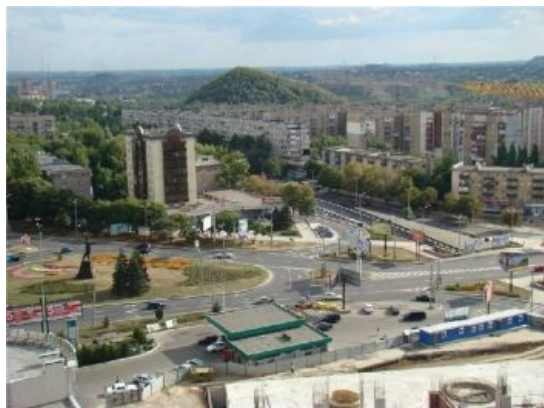
Типичная панорама города

Знаменитый пункт обмена валюты, находящийся во власти понаехавших из этих ваших Африк учиться в Донецкий политех . К подъехавшему на колеснице с мотором или к подошедшему «сам своим пешком» подбегала куча чёрных граждан из некогда дружественных республик, жаждавшая получить бумажных денег, предлагая при этом валюту, девочек, оружие, наркотики... По оперативной информации, курс обмена у негров превышал ставку Нацбанка. Вместо того чтобы менять валюту у местных менял, дончане ездили менять её у негров. Это было выгодно не только из финансовых соображений, но и в силу того, что при обмене у негров не было угрозы быть «прокинутым» через МПХ . Такое положение вещей порождало приступы нехилого баттхёрта у расово донецких менял. В итоге гешефт прикрыли в лучших традициях северо-американских негритянских разборок — одним солнечным днём к Негробанку подъехала машина, с заднего сиденья которой по ничего не подозревавшим обезьянам шарахнули несколько раз из ружья 12-го калибра. С тех пор там валюту не меняют.