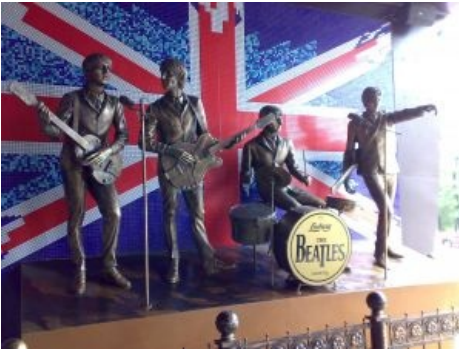
Ага, вот эти ребята из Ливерпуля