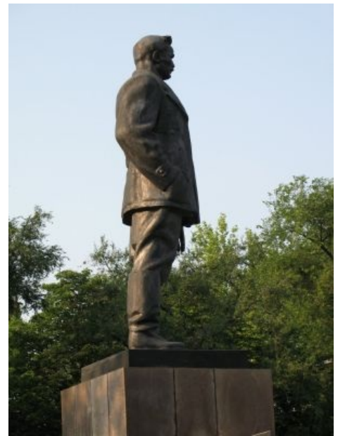
Он самый с ним самым

Вообще, в Донецке очень любят ставить памятники видным общественным деятелям и называть улицы их именами. Так, с недавнего времени появились памятники Иосифу Кобзону и Сергею, нашему, Бубке (у которого из ноги торчит ледоруб), плюс улица имени Ефима Звягильского и вышеупомянутый «Золотой Ринат». Кроме того, есть памятник «Факин Элвис» — на самом деле, это