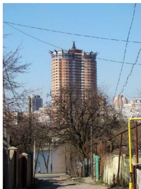
Суть Донецка одним снимком

Несмотря на территориальную принадлежность Украине, 99% жителей региона до сих пор этого не осознано — упорно продолжает говорить на русише и считает себя либо русскими, либо вообще отдельным этносом, не имеющим ни с теми, ни с другими ничего общего. Мол, мы и сами без вас, долбоёбов, проживём, у-нас-заводы-и-шахты-хуле-нам-западенцев-бандеровцев-кормить. Чем вызывают срачи среди укро -украинских политиков. Хотя кому на самом деле принадлежат заводы и шахты, понятно . ЧСХ, на деле, невзирая на весь тяжпром, регион съедает из бюджета больше, чем кладёт туда