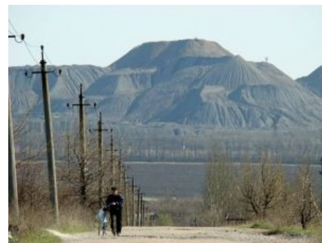
Абориген в естественной среде обитания