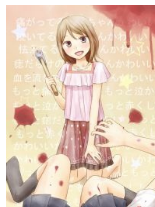
Правило 63 не исключение даже для Супрунюка