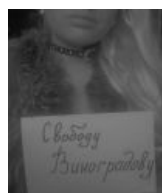
До синдрома скорбящего — один шаг