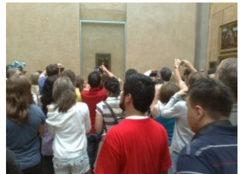
На самом деле их там раза в 4 больше.

Как же выглядит сей шедевр IRL? В зале размером метров десять на двадцать на стене за пуленепробиваемым стеклом висит темная дощечка 76x53 см. Вокруг постоянно толпятся 9000 таких же хомячков-туристов, как и ты, поэтому подойти к картине ближе, чем метров на десять — нереально. Когда желающих причаститься становится слишком много, стояние у картины запрещают, а хомячков собирают в очередь и медленно гонят мимо шедевра, что несказанно способствует восприятию прекрасного. Частота вспышек в зале — примерно 2 Гц. Глядя на потуги фотояпонцев, служители периодически ухмыляются одними глазами — при фотографировании со вспышкой на снимке можно будет увидеть разве что огромный белый блик от пуленепробиваемого стекла. Японцы это тоже подозревают, поэтому пользуются поляризационными фильтрами, раскосо ухмыляясь в ответ.