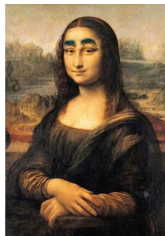
Вариант «Дорогой Леонид Ильич».