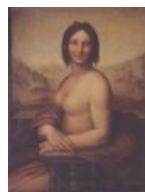
Rule 34 (говорят, что копия с работы самого Лео)