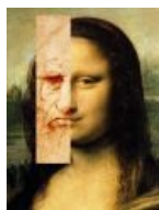
Тайные знаки во все поля