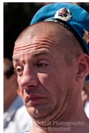
Хочешь быть таким?