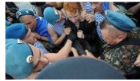
Еще одна трогательная история — ВДВшник накрыл курткой замерзшего гей-активиста .