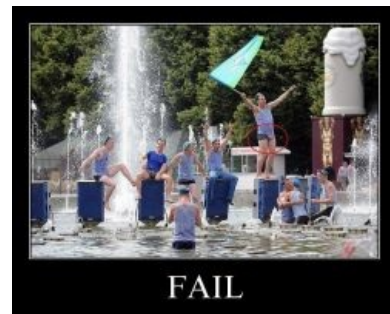
Кто не патриот? Ты не патриот, ёпт!