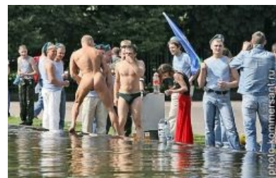
С голой жопой на...