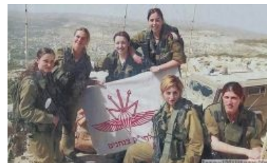
Вторая мировая война