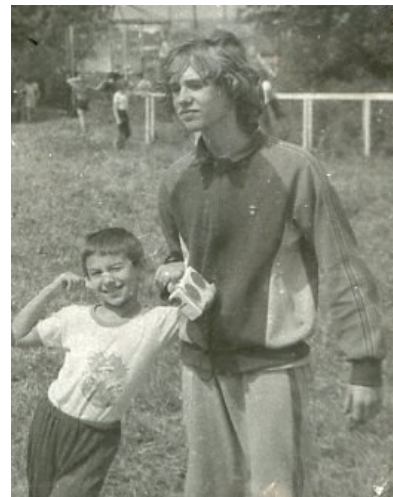
Молодой Дельфин и шота развлекаются [7]

«поскольку, во-первых, текст песен хотя бы должен быть слышен, а во-вторых, дельфин поэт все таки хуйовый, то я совершенно не понимаю, в чем вообще смысл существования этого артиста на российской поп-сцене. »