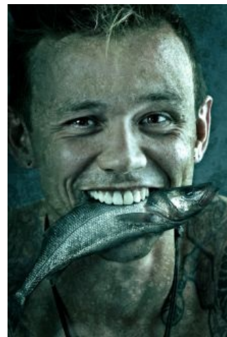
Дельфин пытается доказать, что он — дельфин

Дельфин (он же Dolphin , в миру Андрей Вячеславович Лысков , родился 29 сентября 1971 года) — отечественный креативщик времен лихих 90-х , крёстный отец альтернативной музыки в этой стране. Некогда мрачный сутулый наркоман, недорокер , недорэпер , певец шёпотом и чтец стихов. Прославился, в первую очередь, своими стихами, которые разошлись на цитаты и до сих пор вызывают лютейший срач в интернетах, а также дружбой с Пауком , например, масштабными концертами в начале нулевых и низкокачественной звукозаписью альбомов (что делается умышленно ). Стихи Дельфина призывают, в основном, стать героем всех и каждого, кто не понимает, что жизнь — говно , или же просто думать о смысле своего существования . Всё это делается элементарным путём вкрапления пары-тройки незамысловатых рифм, которые и наталкивают слушателей на эти мысли, благодаря чему Дельфин остаётся популярен среди юного быдла.