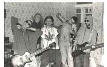
Дубовый Гаай такой дубовый

| Когда ты вернёшься, будет всё, как хочешь ты, Будут смех и слёзы, друзья и цветы, Ну а пока ты там с кем-то где-то ебёшься, А это будет потом — когда ты вернёшься!