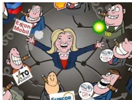
На службе капитализма

Между тем мусульмане , которых Аллах в своём величии без всякой меры наделил природными богатствами, стали подозревать, что их наёбывают и что американские солдаты на их земле служат не для защиты от безбожников-коммунистов, а для контроля цен на нефть. Трижды сотворив подвиг Гастелло , бин Ладен и компания ввергли США в декаду дорогостоящих войн под руководством лихого ковбоя . Новое время подарило мировой лингвистике два шикарных определения: rogue states and axis of evil . Понятия невозбранно включают страны, безбожно отвергающие лучезарные демократические ценности во внутренней политике и потрясающие не соответствующим уровнем их цивилизованности оружием во внешней, а-ля «обезьяна с гранатой». Болезнь лечится принудительной демократизацией , как уже произошло с Афганистаном, Ираком и Ливией — подробности тут .