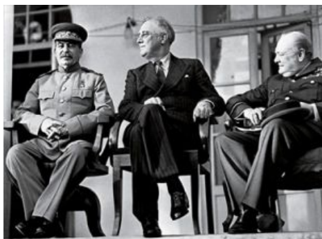
Рис. 1. В угол, на нос, на предмет!

Во время Депрессии большинству стран в мире было просто не до внешней политики. Из масштабных, стратегических мечтателей того времени можно отметить лишь товарища Сталина да его полоумного коллегу партайгеноссе Гитлера — у них были свои планы на будущее. Но экономический пиздец, а главное, крадущийся за ним красный призрак , не могли не повлиять благоприятно на взгляды и стул буржуев и их карманных политиков. За социальными реформами и смягчением абсолютного, «дикого» капитализма последовало смягчение отношения к СССР, ещё недавно считавшемуся непримиримым идеологическим врагом. Ну а среди американской интеллигенции и прочих евреев восхищение сведениями о достижениях коммунизма — почерпнутыми из газеты «Правда» — временами достигало частоты поросычьего визга и нередко кончалось явным или неявным сотрудничеством с бойцами Коминтерна, ИНО НКВД или ГШ РККА . На фоне кризиса многим действительно казалось, что в СССР жить стало лучше, жить стало веселее . Так или иначе, к началу европейской заварушки Рузвельт окончательно завербовался в ряды фоннатов друга детей и физкультурников , причём так, что Черчиллю иной раз приходилось произвольно фалломорфировать от изумления (см. рис. 1). И подарками Франклин предмет своего тихого фапа отнюдь не обделял.