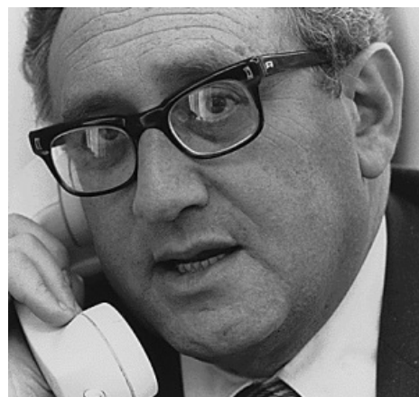
Секундочку, ZOG on line one

Вдобавок у американцев созрела теория Эффекта Домино, где коммунизм распространяется из очага в соседние страны. Это тоже полная хуйня — советская разведка работала во всех странах без исключения. Даже в Антарктиде. Даже в небе. Даже Аллах... Но и американская тоже. Вот список стран, где, по сведениям википедии , во время Холодной войны имели место попытки т. н. «смены режима» по воле США — по политическим, экономическим, или просто личным соображениям: