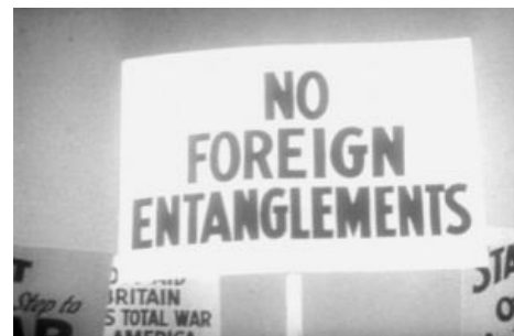
Европа, пошла ты нахуй

В конце войны на смену любвеобильному дедушке Рузвельту пришли молодые энергичные люди, не