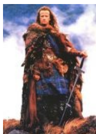
Коннор Маклауд из клана Маклаудов

Сюжет в пяти словах: There can be only one!