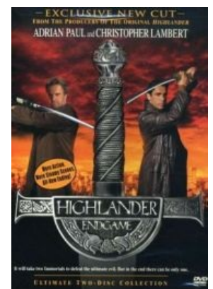
Оба Маклауда в сборе. Коннор, правда, уже не тот

После «Конца Игры» было всё же решено продолжать вселенную, так что есть ещё и Горец 5 — "Источник" (2007), direct-to-video SyFy Channel original movie . Унылейший фильм, который не спасло ничто — даже наличие старых добрых актёров сериала и попытки перепеть старые квиновские темы