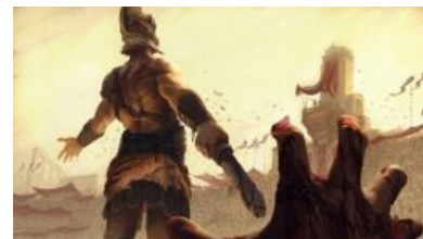
Как то так

Как известно из авторитетных источников , чья правдивость не может подвергаться сомнению , если поверженный гладиатор ещё почему-то оставался жив, его участь решал устроитель игр (а в Риме — сам Император ) путем демонстрации одного пальца. Нет, не того . Если побеждённый доставил публике или самому императору (хотя тот чаще старался угождать публике и показывал то, что кричала чернь), тот ставил ему лойс путем поднятия большого пальца вверх. Если же император показывал палец вниз, то проигравшего добивали.