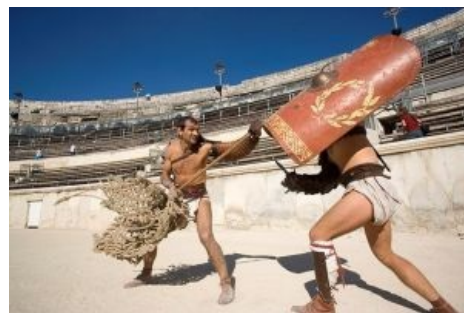
Ретиарий против мурмиллона

вида объекта своего воздыхания. ЧСХ, в отличие от современных поклонниц всякого рода педиков , античные фанатки за небольшую сумму могли спокойно поебаться со своим кумиром. Кроме любви плебеев, гладиатор мог получить благосклонность самого императора и получать ништяки до конца жизни. Но в любом случае победителю была гарантирована солидная премия, которую можно было потратить на блекджэк и шлюх или же на выкуп своей жопы из рабства. Но тут кроется западло: чем больше побеждал гладиатор и, соответственно, больше зарабатывал денег на свой выкуп, тем дороже он стоил. То есть можно было копить всю жизнь и так и не накопить .