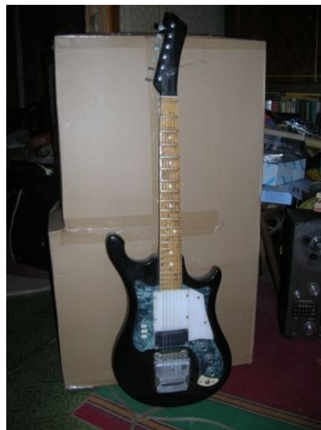
Минус лишние детали, плюс 1 хамбакер

Урал является счастливым обладателем корпуса из «дерева гитарного» с топом из листа трёхслойной фанеры, прибитого бревна системы «гриф» из древесины той же породы с накладкой из неизвестного науке материала. Этот чумовой суперстрат оснащен тремя звукоснимателями системы «бжжж» в корпусе размером с пару хамбакеров каждый. Регуляторам и переключателям может позавидовать даже панель управления самолётом — это единственная гитара с переключателем «вкл/выкл». Вообще, надо заметить, вся электронная начинка — это нечто. Что, в принципе, и неудивительно — нормальных книг по гитаростроению в этой стране нет и сейчас, зато всяких учебников юного радиотехника всегда было навалом. Как результат — количество ручек, тумблеров и прочего заметно превышало все разумные пределы. Существовали даже гитары со встроенными фуззами и прочими свистелками. Можно так и вообще свою сделать: стамеска, рубанок и журнал «Юный техник» № 2-1988 — гитара готова.