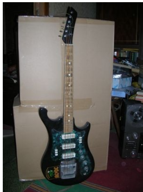
Басовые струны на шестиструнке

Именно на гитарах «Урал» ковался весь советский говно- и просто рок, начиная от Аквариума и Кино и заканчивая сибирскими панками кроме Гражданской обороны (у ГрОб ВНЕЗАПНО! был болгарский бас «Орфей» и «Музимы», а на «Коммунизме» — французский Gibson 1970-го года). Собственно, чтобы услышать, как способны звучать эти инструменты, достаточно послушать ранние произведения указанных групп. А что вы думали? Легендарная Yamaha Каспаряна, привезенная из Финляндии его товарищем — моржом, стоила под стать «Волге» и была едва ли не единственным действительно нормальным инструментом во всем питерском рок-клубе. Денег у нищих рокеров первой волны на такие излишества в подавляющем большинстве случаев не было, поэтому пределом мечтания в конце 70-х — начале 80-х были изделия наших социалистических товарищей из Musima ( Восточная Германия ) или Jolana (Чехословакия).