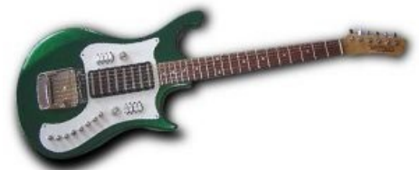
Урал и его 8 звукоснимателей