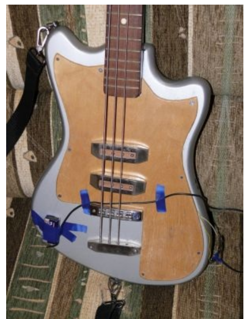
Бас «Соло Бас — 1» с внешним источником питания. А кто порвал одну струну?