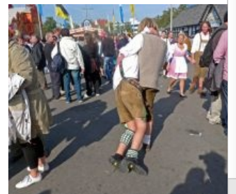
Ариец выпустил свинью