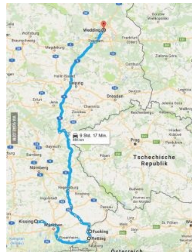
От поцелуя до свадьбы в Дойчланде всего 10 часов

https://www.youtube.com/watch?v=dNZPT8TjUDw