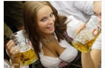
Хочешь такого пива, %username%?