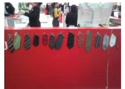
Трофеи злобных феминисток