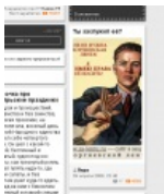
«Я имею право на оргиевскую ленточку» Я помню, я горжусь