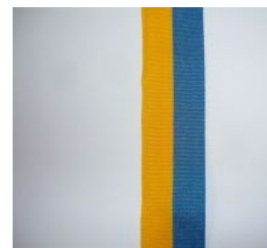
Белорусская. Выложена буквой...