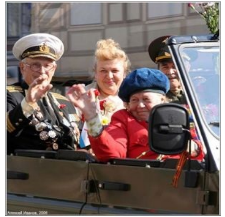
Ветераны на акции ленточки