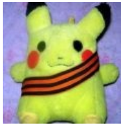
Покемоны тоже воевали!