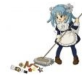
Википе-тя убирает проявления патриотизма