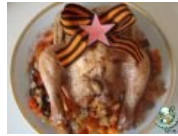
Курица тоже помнит и гордится