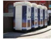
Значит, вы уж меня извините, в туалете закроемся, мы и в сортире будем гордиться, в конце концов