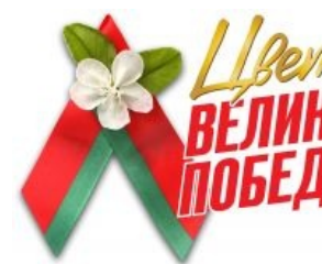
Белорусская. Выложена буквой...