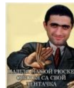
Весёлый хач тоже не хочет эту вашу ленточку