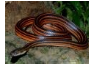
Ленточка смотрит на курицу тебя как на ветерана