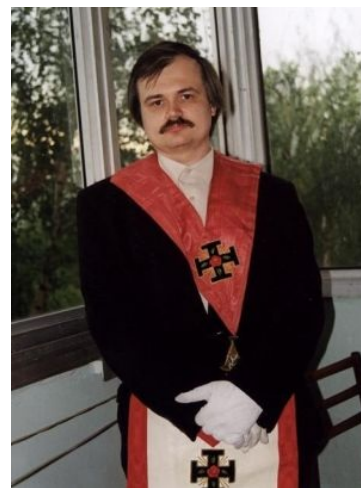
Русский философ на заре карьеры.