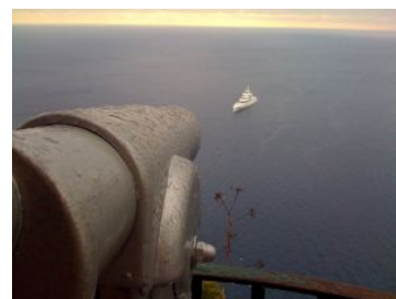
Мир по Галковскому

1. Таблица «гегемон-субгегемон» (на базе [3])