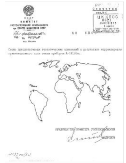
Не надо шутить с войной!

Помню, много лет назад на складах одного порта производилась ревизия. Кладовщик был в отпуске, и начальник складов сам предъявлял оборудование комиссии. Все оказалось в наличии, кроме медной калябры, числившейся по описи. Никто не знал, что это такое. Председатель комиссии предупредил начальника складов, что если не будет найдена калябра, то дело может принять скверный оборот, тем более, что калябра, очевидно, вещь очень нужная, иначе на ее изготовление не стали бы тратить дефицитную медь. На розыски калябры были мобилизованы самые старые работники складов, но никто из них не мог сказать, как эта калябра выглядит. Назревали крупные неприятности. Наконец, кто-то догадался сплющить под молотом медный чайник и предъявить его комиссии в качестве калябры. Все облегченно вздохнули. Когда же вернулся из отпуска кладовщик, выяснилось, что медная калябра никогда не существовала, а были мерные калибры, выброшенные после ревизии в утиль, так как они нигде не числились. Причиной возникшей путаницы был неразборчивый почерк кладовщика. Но отработывать назад было уже поздно. Калябра значилась в актах ревизии. Вероятно, до сих пор на этом складе хранится сплющенный чайник, носящий таинственное название «калябра»).