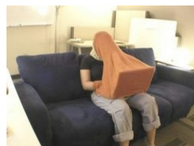
Порноскоп , ИРЛ: [[1]]

Chrysler Turbo Encabulator Применение турбоэнкабулятора в промышленности