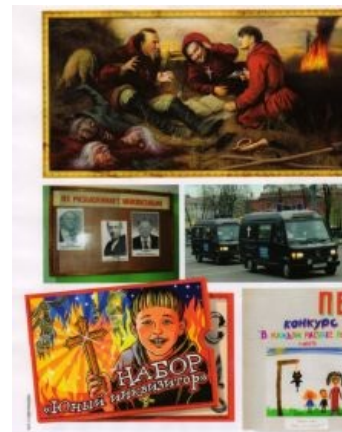
Набор «Юный инквизитор»

Набор «Юный Vault Dweller». Реально выпускался в 1950—1951 гг. ( пруфлинк )