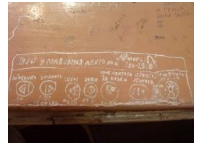
Пульт управления лектором ПУЛ-2.1, встроенный в парту кафедры анатомии Первого МГМУ им. И. М. Сеченова

вручную». Опционально конструкция снабжена ручкой управления громкостью. В некоторых усовершенствованных моделях имеются дополнительные кнопки: «Перемотка назад», «Перемотка вперёд», «Пауза» и «Обратное воспроизведение», «Сохран./загр. лекцию», «Лулз от препода», «Перекур», «Телепортация в %place%», «Автозачет», «Вызов военкома» и даже «Заказ военного билета». Функционал пультов совершенствуется и модернизируется с каждой версией. На пульте модели ПУЛ-2.1, расположенном где-то в аудитории на кафедре анатомии Первого МГМУ им. И. М. Сеченова, имелся разъем для наушников, а также присутствовала кнопка «Сменить лектора». Заботливый разработчик учёл, что некоторым очень сильно надоедает один и тот же лектор или что лектор так плохо читает лекции, что потом приходится готовиться по учебникам. На одном из пультов РХТУ им. Менделеева наблюдалась возможность изменения эрекции полового члена лектора, для чего были предусмотрены регуляторы грубой и точной настройки. Очевидно, конструктор этого пульта имел сильную сексуальную озабоченность.