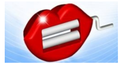
Гламурный вариант ГЗ

складываться до карманного варианта (при этом, по-видимому, масса тоже уменьшается). Превращает любые электроприборы в злых роботов при соприкосновении (или даже если рядом постоит), при этом похуй, из чего электроприбор был сделан — получившийся робот будет иметь кучу функций, не заложенных в исходное устройство. Любой кусочек куба работает так же как целый куб. Другой характерной особенностью является то, что в кубе содержится некое секретное знание , которое передается опять же через прикосновение. При этом получивший знание пациент получает какое-то психическое расстройство с продуктивной симптоматикой : начинает опровергать теорию относительности, аргументируя свою точку зрения какими-то иероглифами.