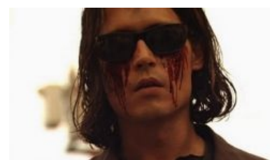
После применения глазвыколупывателя. Oh, exploitable!