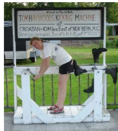
Пинательный автомат имени Тома Харвардса. Его прототип «вдувательный автомат» не прошёл испытания цензурой