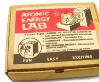
Набор «Юный Vault Dweller». Реально выпускался в 1950—1951 гг. ( пруфлинк )