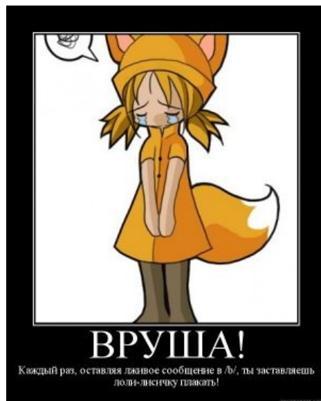
Лисий демотиватор .

domain: IICHAN.RU type: CORPORATE nserver: ns1.imena.com.ua. nserver: ns2.imena.com.ua. nserver: ns3.imena.com.ua. state: REGISTERED, DELEGATED person: Konstantin Grusha phone: +38044 4191699 e-mail: hostmaster@imena.ua registrar: RUCENTER-REG-RIPN created: 2007.05.24 paid-till: 2008.05.24 source: TC-RIPN