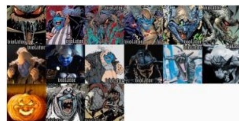
Арт «Петрик-Осквернитель» by

Незаурядность Петрика отмечалась еще в молодости. В то смутное время Витя еще не занимался коммерцией. В 1960-х годах уехал в Ленинград и поступил в военную академию, где и проявились его способности в гипнотической области . В результате старшине пришлось сменить рядового Петрика на уборке туалетов (уже тогда он умел промывать мозги), после чего Витю отправили обучаться в другой университет. Диплом по методике внушения в парапсихологии стал, по мнению специалистов , настоящей докторской диссертацией. Ещё обучаясь на курсе психологии, Виктор Иванович Петрик параллельно проходил в Ленинградском государственном университете курс физики. Который, как можно