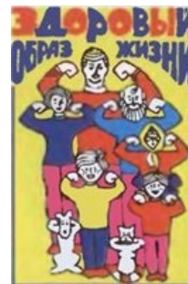
Zog Irko Oy!

Вестник ЗОЖ — печатный орган Апокалипсиса, предлагающий жителям Российской Федерации лечиться кусками проволоки и порошком из медведек. Из таинственной аббревиатуры «ЗОЖ» и названия издательства — Zog Irko Oy можно сделать прямой вывод, что журнал выгоден евреям.