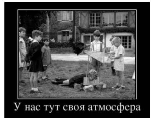
Испытание детского образца гильотины

С наступлением новых времен, как все думали тогда, требовались совершенно радикальные реформы. В том числе был отменен такой