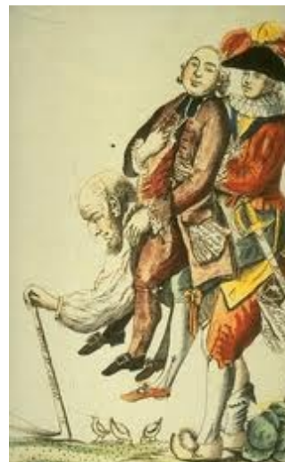
У Жака-простака широкая спина, всё вынесет...

12 июля 1789 года Париж узнал о том, что их любимого министра Неккера, с которым связывали надежды на выход Франции из тяжелого социально-экономического и политического кризиса , попросили