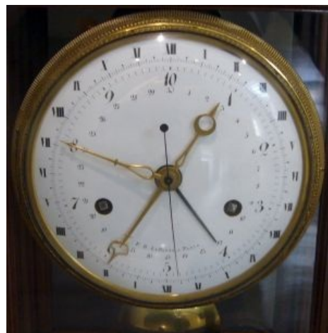
Образец часиков с революционным десятичным циферблатом.

А вскоре к власти пришёл один маленький человек , и автократия была восстановлена. Много хорошего сделал этот парень за свое правление: спас Францию от полного разгрома Европой (Итальянский и Швейцарский походы Суворова, например), устранил