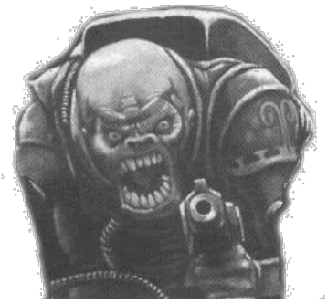
Довольный и радостный гибрид ген-стилера.

полноценные ген-стилеры (горбатые, хвостатые, четырёхрукие и с клешнями, способными вскрыть силовые доспехи космопеха, как яйцо от киндер-сюрприза). Однако, цель генокрадов — сохранять инкогнито до самого вторжения тиранидского роя и, главное, звать этот самый рой на «кухню». Тот самый «первый» генокрад (если, конечно, выжил), со временем вырастает, толстеет и умнеет, становясь лидером культа — так называемым «патриархом» ( Broodlord , он же Patriarch ) — обзаведётся усиленной костяной броней и когтями, режущими алмазными на счет «раз». Если умер, то «патриархируется» самый старый из новых генокрадов. Также, в силу развитого мозга, обладает mindcontrol'ными способностями. Культисты генокрадов засветились в настолке в качестве одной из сторон в игре Deathwatch Overkill , а совсем недавно даже заиграли себе полноценный кодекс.