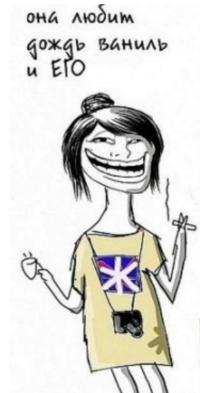
Собирательный образ ВП