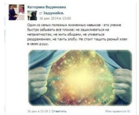
Глубокомысленная цитата и подозрительная картинка