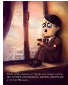
И целого мира мало...