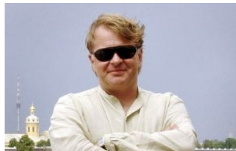
Пилигрим мерзко ухмыляется