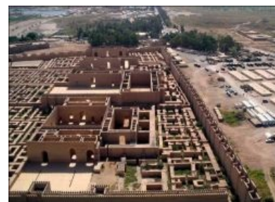
Реконструированные остатки Вавилонских подворотен в 2005 году