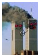
Здесь тоже сходство наблюдается