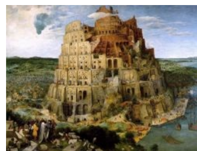
Самая известная картина

Prokofiev, Sergei - Seven, They are Seven, Op. 30 «Семеро их». Музыка Прокофьева, слова вавилонские