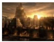
Так видят Вавилон на «Девиянтарте»