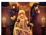
Гильгамеш и его мастера в женских обликах